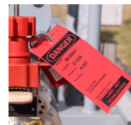
5 Industriële tags