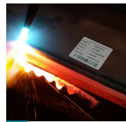
11 Heavy duty