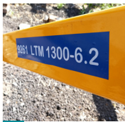
9 Industrial Vinyl